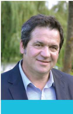
Éric FRETILLÈRE, Président d'IRRIGANTS de France

L'irrigation assure les productions et leur qualité, c'est essentiel aussi bien pour les agriculteurs que pour les citoyens qui aspirent à une alimentation saine et produite en France. Ces dernières années, les aléas climatiques n'ont pas épargné les agriculteurs français : sécheresses, épisodes pluvieux ou températures extrêmes. L'irrigation reste la meilleure assurance récolte et contribue à la durabilité économique des filières. C'est pourquoi, l'agriculture irriguée est un atout qui doit être pleinement soutenu en France. En cette année de changement, IRRIGANTS de France compte sur les nouveaux élus français pour débattre de cette question essentielle de l'eau dans notre pays.